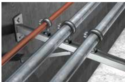
Fissaggio di tubazioni a parete