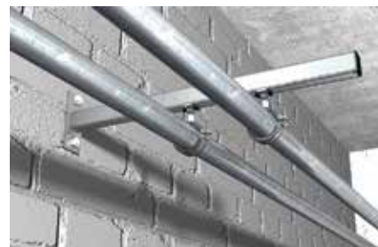
Fissaggio di tubazioni leggere